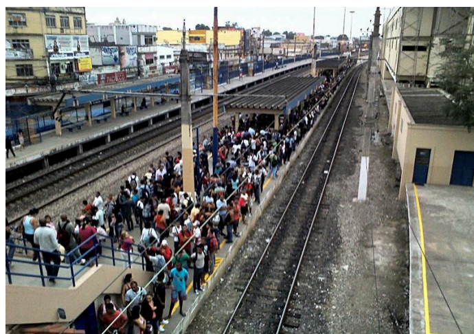
► Estação de Queimados, manhã de problemas no ramal Japeri.

SOBRAL, B. Metrópole do Rio e projeto nacional: Uma estratégia de desenvolvimento a partir de complexos e centralidades no território. Garamoud, Rio de Janeiro, 2013.